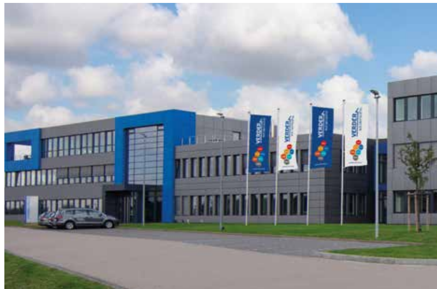
Eltra GmbH in Haan, Deutschland

Seit 2012 ist ELTRA Teil der Verder Gruppe und investiert konsequent in Forschung und Entwicklung. Mit der Markteinführung der ELEMENTRAC Serie mit leistungsfähiger ELEMENTS Software bietet ELTRA Analysatoren für die schnelle und zuverlässige O/N/H und C/S Analytik an, die neben modernem Design und komfortabler Bedienung integrierte Lösungen für spezielle Anforderungen bieten. So erlaubt die von uns entwickelte Dual Furnace Technology die Analyse von organischen und anorganischen Proben mit nur einem Gerät - ein Konzept, das nur ELTRA anbietet.