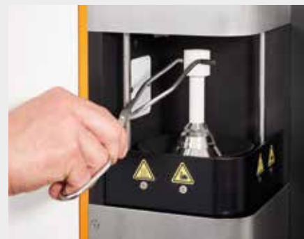
Probe dem Gerät zuführen