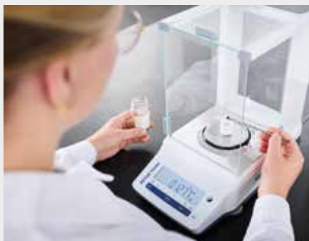
Einwiegen einer Probe

Allen ELTRA Analysatoren ist die einfache Bedienung und die schnelle C/S oder O/N/H Messung von Pulvern, Granulaten, Drähten oder Folien gemein. Nach Einwaage der Probe und deren Anmeldung in der Software, finden je nach Analysenstart alle weiteren Schritte automatisch statt und die Ergebnisse stehen schnell in der übersichtlichen ELEMENTS Software zur Verfügung.