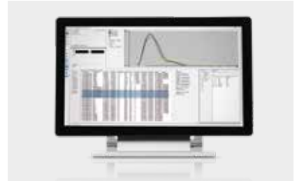
Ausgabe Messergebnisse und Export