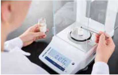
Anmelden der Probe in der Software und Einwaage

Die Bedienung des C(H)S 580 A ist einfach, schnell und komfortabel. Die Proben werden eingewogen und in der Software als manuelle Analyse oder Analyse via Probegeber angemeldet. Typische Einwaagen liegen zwischen 50 und 500 mg. Nach Analysenstart erfolgt die Probenzufuhr in den Ofen und Messung der Verbrennungsgase \text{CO}_2 , \text{H}_2\text{O} und \text{SO}_2 in bis zu vier Infrarotmesszellen. Ein Export der Messergebnisse ist via LIMS; Report oder Textfile möglich.