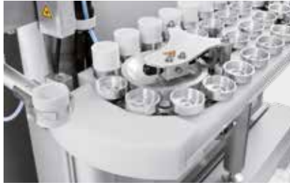
Platzierung auf dem Probengeber und Analyse